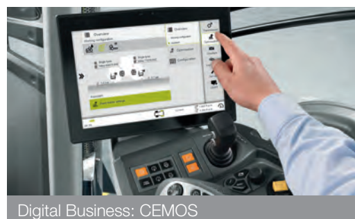
Digital Business: CEMOS